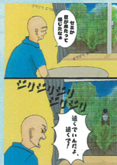
1頁漫畫【高中組】(Distance-距離)