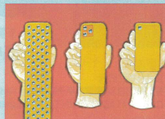
1頁漫畫【一般組】(成果-距離)